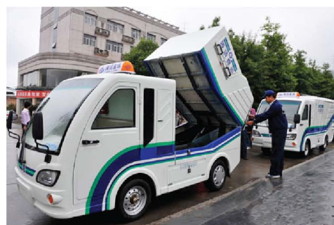
新型新能源环卫车