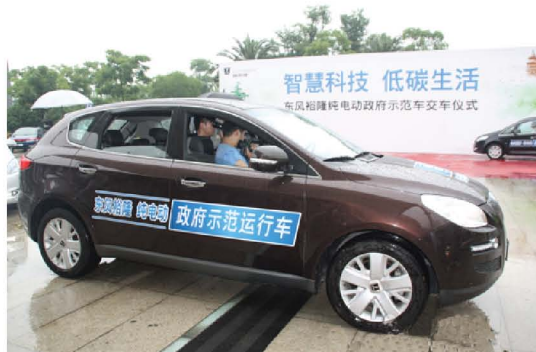
杭州市首批纯电动政府示范运行车

目前，杭州市公务、市政车辆中已经有部分新能源车辆投入使用作为示范车，杭州市经信委相关负责人表示，杭州市计划在2012年采购3000辆新能源车辆进入环卫、邮政、公交等公共运输领域，同时还必将有一定比例的新能源汽车作为行政系统公务用车。