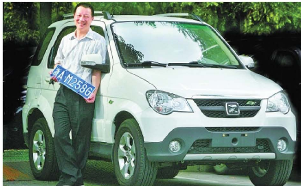
浙江第一位私人纯电动汽车车主

杭州市民对于新能源汽车的态度已逐渐发生变化，越来越多的杭州市民开始接受新能源汽车作为私家车进入家庭。截止到今年6月，杭州已有742购买了新能源汽车并投入使用，并将在近期拿到相关补贴。