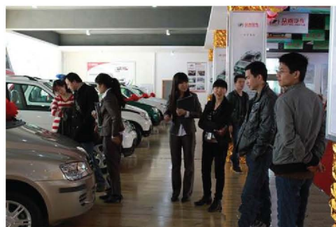
全国首个新能源汽车展销中心 市民对展销中心的新能源汽车表现出了极大的兴趣