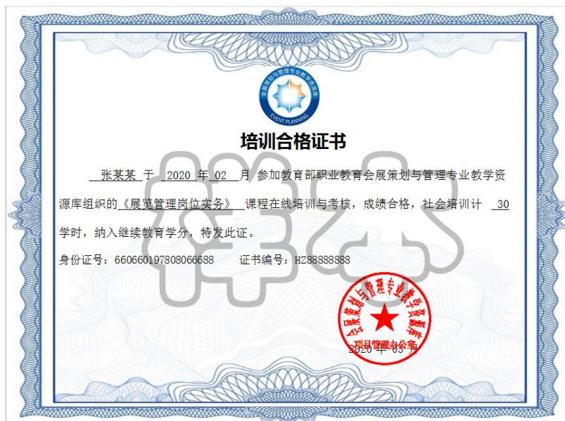
课程培训合格证书（样本）